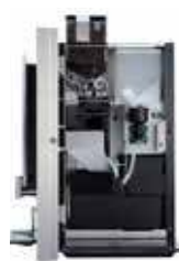
OPTIBEAN 2 (XL)