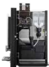
OPTIBEAN 3 (XL) TOUCH