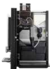
OPTIBEAN 2 (XL) TOUCH