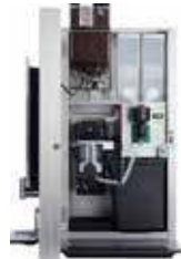
OPTIBEAN 3 (XL)