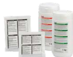
Entkalkungsmittel und Kaffeiansatzlösung